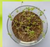
Prüfkörper 2 nach 11 Tagen