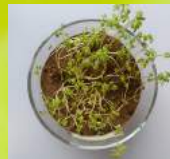
Prüfkörper 1 nach 11 Tagen