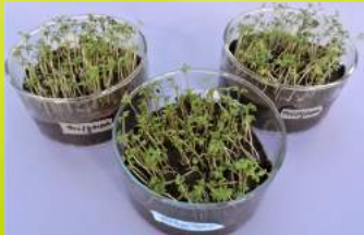
Abb.1: Gesamtproben ohne und mit Prüfkörper nach 5 Tagen

Für die biologische Abbaubarkeit von Kunststoffen spielt die Rohstoffherkunft, also die Tatsache ob fossile oder nachwachsende Rohstoffe bei der Herstellung des Produkts verwendet wurden, keine Rolle. Entscheidend dafür, ob ein Material biologisch abbaubar ist, ist ausschließlich seine chemische Struktur. Nur wenn Mikroorganismen und Pilze bzw. deren Enzyme die Moleküle, aus denen der Kunststoff besteht, spalten und vollständig verstoffwechseln können, ist dieser auch biologisch abbaubar. Biologisch abbaubare Kunststoffe werden durch Mikroorganismen vollständig zu Kohlendioxid (CO 2 ), Wasser (H 2 O), mineralischen Salzen und Biomasse zersetzt. In der Vergärung kann beim Abbau zusätzlich noch Methan (CH 4 ) entstehen.