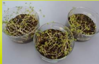
Abb. 2. Gesamtproben ohne und mit Prüfkörper Biodegradable nach 30 Tagen

In standardisierter Versuchserde unter aeroben Bedingungen wird über den gesamten Prüfzeitraum die biologische Aktivität anhand verschiedener Parameter (Temperatur, Bodenfeuchte) überwacht. Die Tests können wahlweise unter definierten Laborbedingungen oder unter praxisrelevanten Freilandbedingungen durchgeführt werden. Die Auswertung der Versuche erfolgt nach vorgegebener Prüfdauer über die Abbaurate von Produkten sowie die Umweltverträglichkeit, bzw. Umweltbelastung durch verrottende Produkte (über ökotoxikologische Untersuchungen oder chemische Analyse). Für diese Endparameter werden jeweils standardisierte Verfahren eingesetzt.