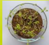
Originalprobe nach 11 Tagen

In standardisierter Versuchserde unter aeroben Bedingungen wird über den gesamten Prüfzeitraum die biologische Aktivität anhand verschiedener Parameter (Temperatur, Bodenfeuchte) überwacht. Die Tests können wahlweise unter definierten Laborbedingungen oder unter praxisrelevanten Freilandbedingungen durchgeführt werden. Die Auswertung der Versuche erfolgt nach vorgegebener Prüfdauer über die Abbaurate von Produkten sowie die Umweltverträglichkeit, bzw. Umweltbelastung durch verrottende Produkte (über ökotoxikologische Untersuchungen oder chemische Analyse). Für diese Endparameter werden jeweils standardisierte Verfahren eingesetzt.